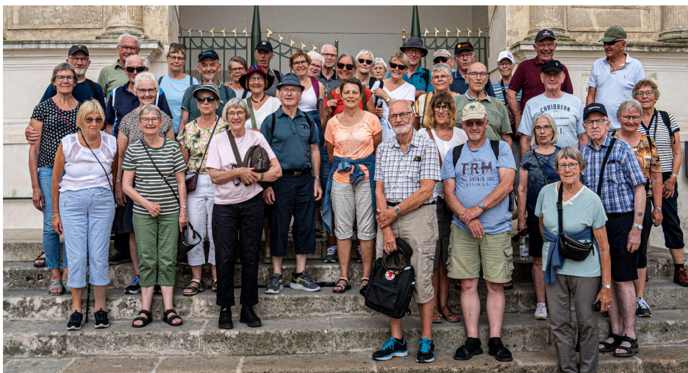
En flok glade LandboSeniorer fra vores tur til Apulien.