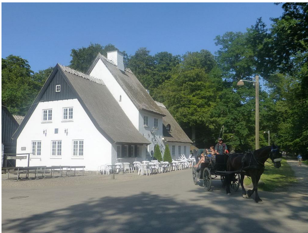
Peter Lieps Hus Dyrhavsbakken

Syd-Østvendssysel Seniorklub har i år arrangeret tur til København og Cirkusrevyen. Turen er planlagt efter bedste evne og viser kulturelle og festlige muligheder som en 3-dagstur kan give. Bestyrelsen håber, at turen vil falde i medlemmernes smag og ser frem til en behagelig tur i hyggeligt samvær.