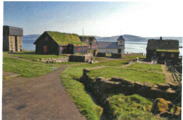
Kongsgården i Kirkjubøur