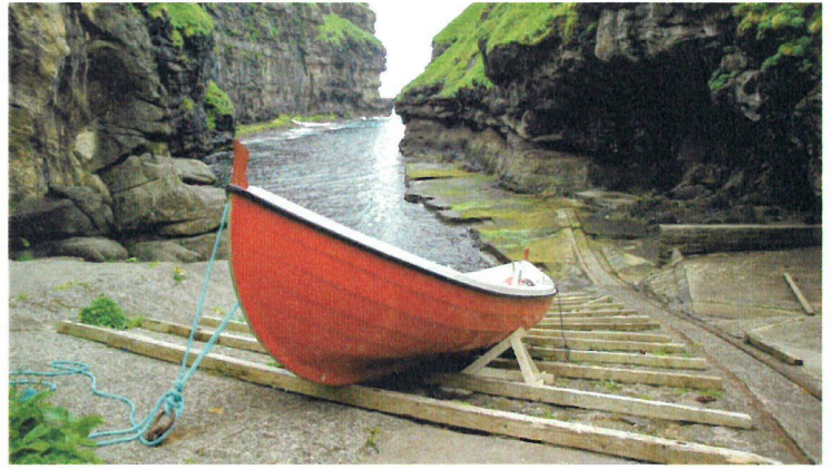
Naturhavnen i Gjógv