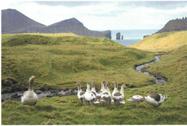
Udsigt til Risin og Kellingin