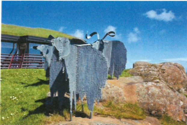
Kunst ved Nordens Hus

Til middag får vi besøg af en herboende dansker. Han vil efter middagen fortælle om livet på Færøerne i dag.